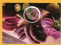
虹の森公園かごもり市場