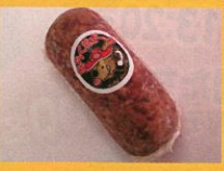
しまなみイノシシ活用隊