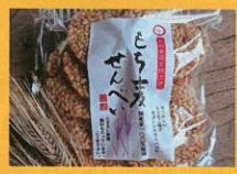
(有)ジェイ・ウィングファーム