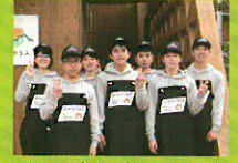
八幡浜高校商業研究部