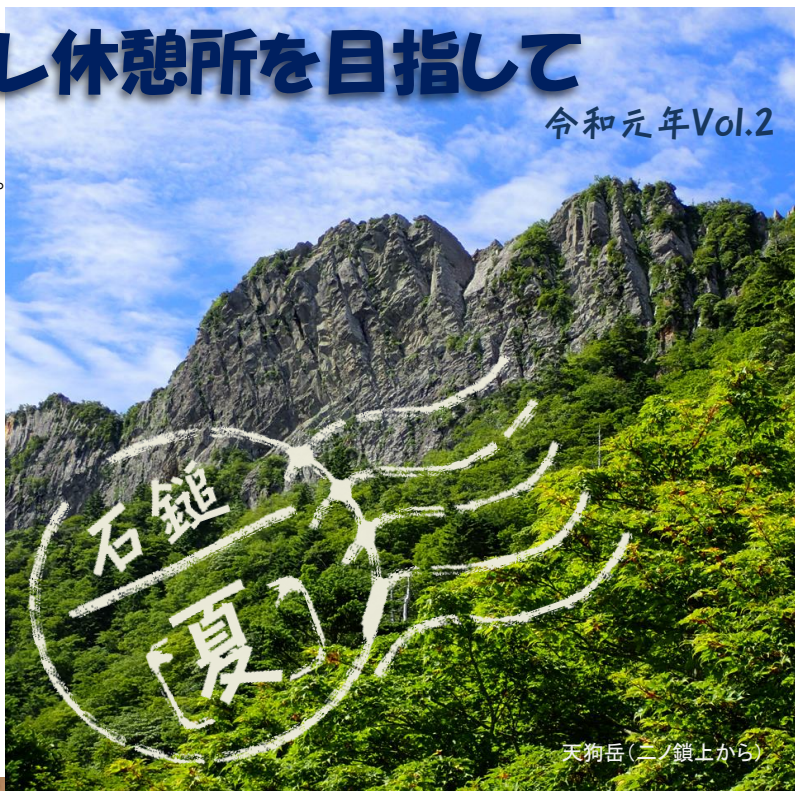
天狗岳(二ノ鎖上から)